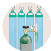
TANQUES O BALAS DE OXÍGENO